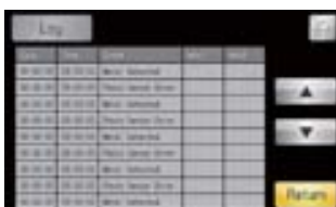
พอร์ตUSB ช่วยบันทึกข้อมูลการทำงานลงบนแฟลชไดร์ สามารถนำไปเปิดบนไฟล์ Excel ได้เลย