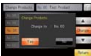
การทำงานแบบอินเตอร์แอคทีฟ ผู้ใช้จะรู้ตลอดเวลาว่ากำลังทำอะไรอยู่และกำลังจะทำอะไรต่อไป