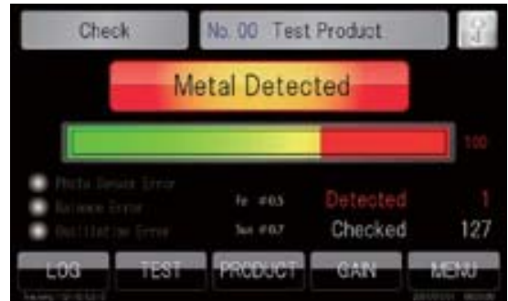
มีการแสดงสถานะการทำงาน และแจ้งเตือนเมื่อมีการตรวจพบโลหะอย่างชัดเจน