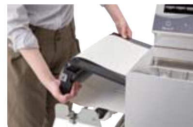
สายพานถอดล้างได้ด้วยคนเดียว ไม่ต้องใช้เครื่องมือ