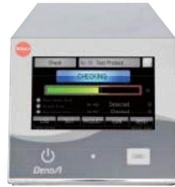
หน้าจอระบบสัมผัส สว่างจ้า สีสัมผัสใส ขนาด 7 นิ้ว

ได้รับการออกแบบเฉพาะพิเศษสำหรับใช้ งานในอุตสาหกรรม โดยเฉพาะการผลิตอาหาร เน้นพิเศษในเรื่องประสิทธิภาพการตรวจจับที่ดีที่สุดรวมถึงการใช้ งานที่ง่ายไม่ซับซ้อน กับสุดยอดเทคโนโลยีหลายต้นกำเนิดความถี่ ให้ได้ประสิทธิภาพการตรวจจับที่ดีที่สุด ไม่ใช่แค่ Fe เท่านั้น ยังรวมถึง Non-Fe และ SUS อีกด้วย ผลิตเพลิ้นไปกับหน้าจอระบบสัมผัส ที่เสมือนหยั่งรู้ เข้าถึงจิตใจของผู้ใช้งาน มา "สัมผัส" กับเรา ด้วยหน้าจอสว่างจ้า สีสัมผัสใส ขนาด 7 นิ้ว ตอบสนองกับทุกการสัมผัส