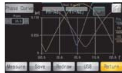
ฟังก์ชันการหาค่าเฟสอัตโนมัติ เครื่องจะเสิร์จหาค่าที่ดีที่สุดสำหรับสินค้าของคุณ